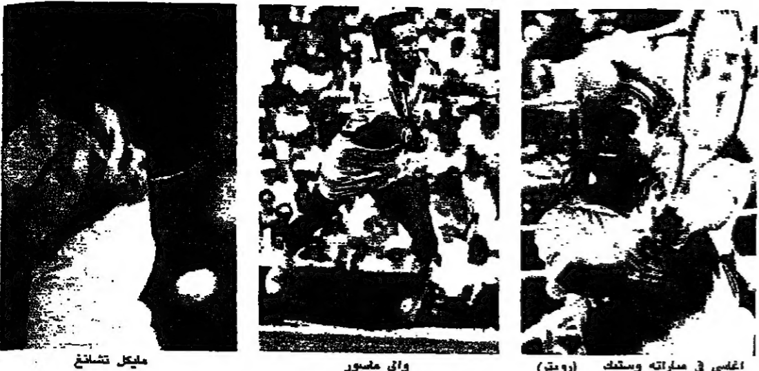
الغربي في مباراته وستي (روبيرت)

سقط الالميركي براد غيلبرت المصنف ثانياً في الدور الثاني من بطولة كندا المفتوحة لكرة المضرب في تورونتو اثر خسارته امام مواطنه تود ويتسكن ٧/٥ و ٤/٦. ويحتل غيلبرت المركز السادس على ايسلندا ويويتسكن المركز الخامس والستين.